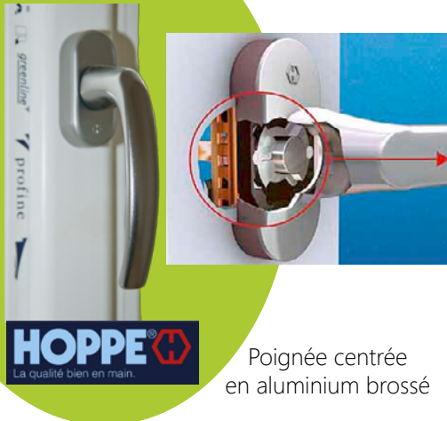
Poignée centrée en aluminium brossé

Grâce à deux joints de frappe, le système e.VOLUTION 70mm offre une excellente imperméabilité à l'air ainsi qu'une étanchéité à l'eau optimale (Valeurs A et E de l'essai A.E.V.)